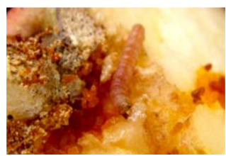
lagartas de G. molesta

pulverizações de inseticidas com destaque para os organofosforados e piretróides. Embora novos grupos químicos tenham sido recentemente introduzidos para o manejo destes tortricídeos, uma das principais preocupações dos técnicos e produtores é que o uso continuado do controle químico possa selecionar populações de insetos resistentes.